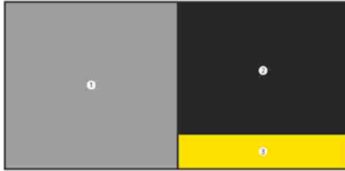
الشكل 2 نمط متجانب: 1: الصورة، 2: العبارة، 3: رسالة الإقلاع

د- في حال كان ارتفاع التحذير الصحي أعلى من 20% لكن أقل من 65% من عرضه، يوضع التحذير الصحي على نمط متجانب حسب الشكل 2.