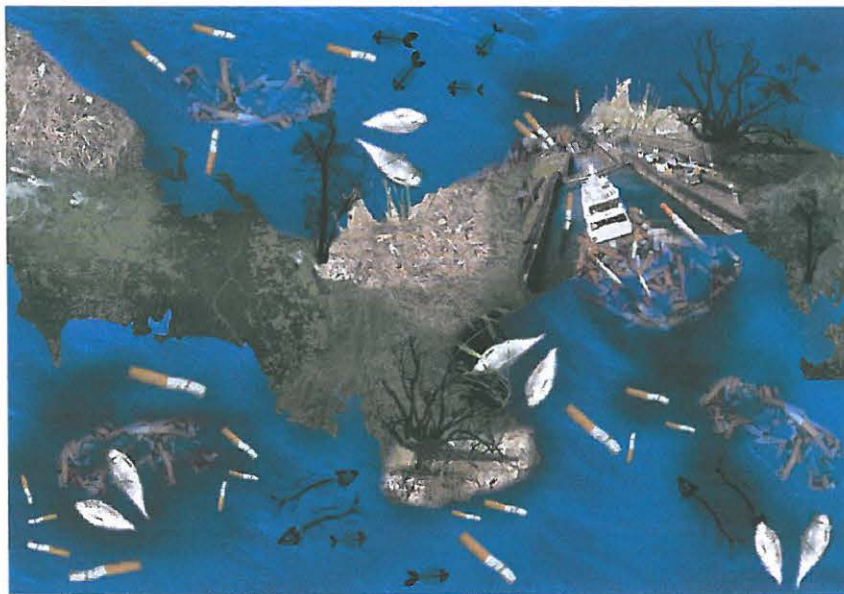
LA COLILLA DE CIGARRILLO CONTAMINA NUESTRAS AGUAS