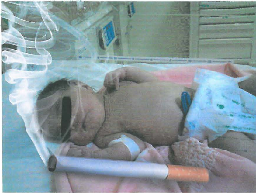
EL HUMO DE TABACO LOS AHOGA Y ENFERMA.

ARTÍCULO SEGUNDO: Informar a las industrias manufactureras, importadoras, distribuidoras y comercializadoras de los productos de tabaco, que las advertencias sanitarias deberán reproducirse en los envases y cajetillas de los productos de tabaco, en proporciones iguales durante todo el periodo de circulación para todas las marcas.