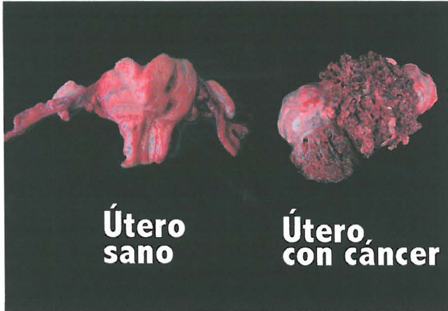
FUMAR PUEDE CAUSAR CÁNCER DE ÚTERO