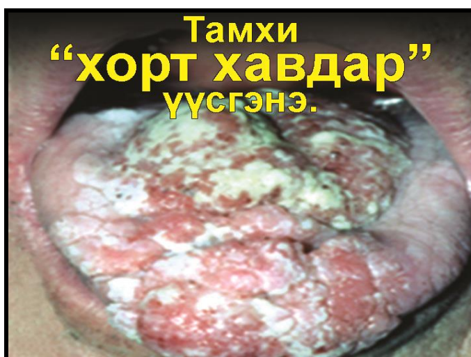
Зурагт анхааруулга № 3