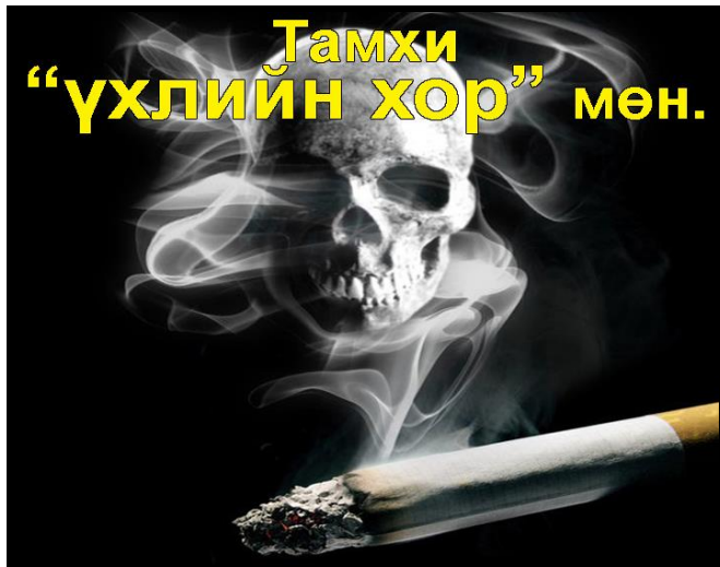
Зурагт анхааруулга №6