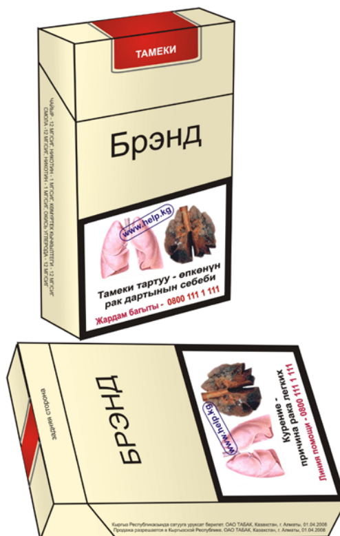
Рисунок 3. Расположение информации на боковых поверхностях пачки сигарет.

5. С другой боковой поверхности каждой пачки и упаковки табачных изделий должна содержаться информация об уровне смолы, никотина и окиси углерода в одной единице табачного изделия (Рис.3). Информация об уровнях содержания смолы, никотина и окиси углерода должны быть напечатаны на кыргызском и русском языках таким образом, чтобы они покрывали, по меньшей мере, 40% соответствующей площади.