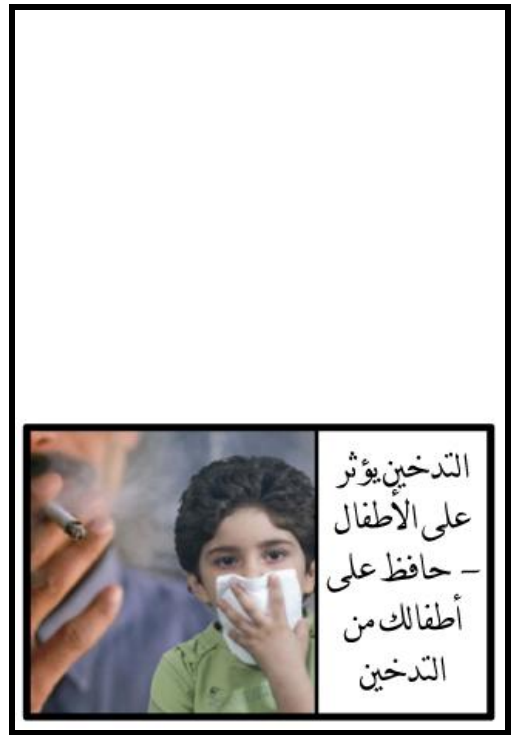
الشكل ٢ - الصور التحذيرية (تتمة)