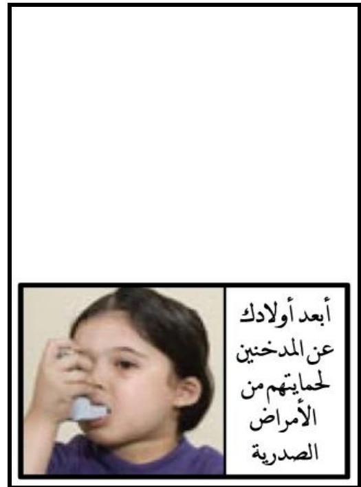
الشكل ٢ - الصور التحذيرية