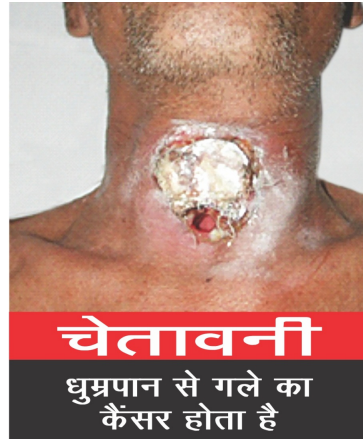
चित्र – 1

(ख) तम्बाकू उत्पादों के धूम्रपान रूपों वाले पैकेजों के लिए - चित्र (2) इन नियमों में सम्मिलित विनिर्दिष्ट स्वास्थ्य चेतावनी चित्र (1) की विनिर्दिष्ट स्वास्थ्य चेतावनी की आरंभ होने की तिथि से बारह माह समाप्त होने पर प्रभावी होगी।